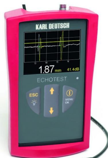
ECHOTEST 1077 Data, ECHOTEST 1077 LF Data