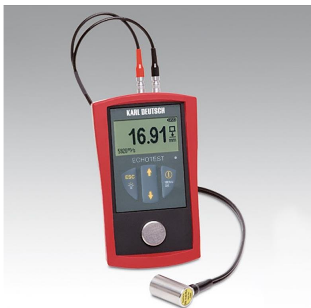
ECHOTEST 1076 Basic; ECHOTEST 1076 Data, ECHOTEST 1076 TC Basic, ECHOTEST 1076 TC Data