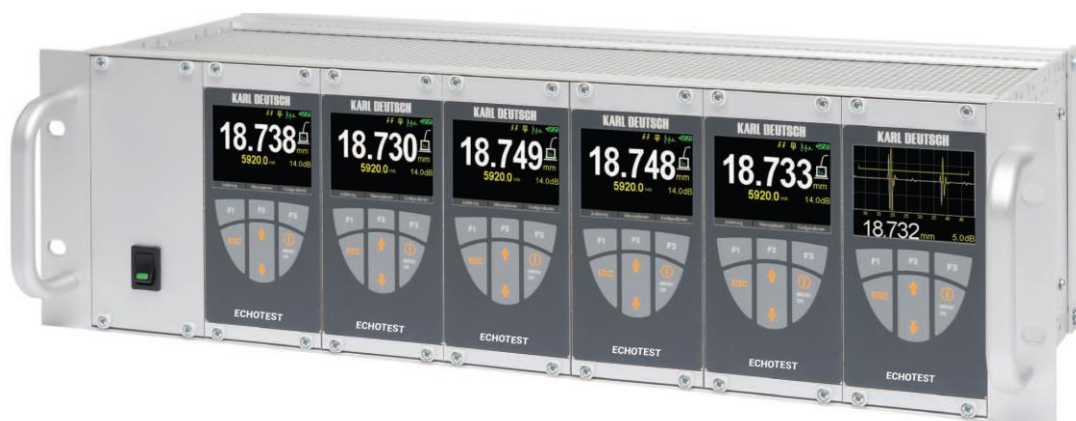
ECHOTEST 1077 Data, ECHOTEST 1077 LF Data, объединенные в специальной стойке